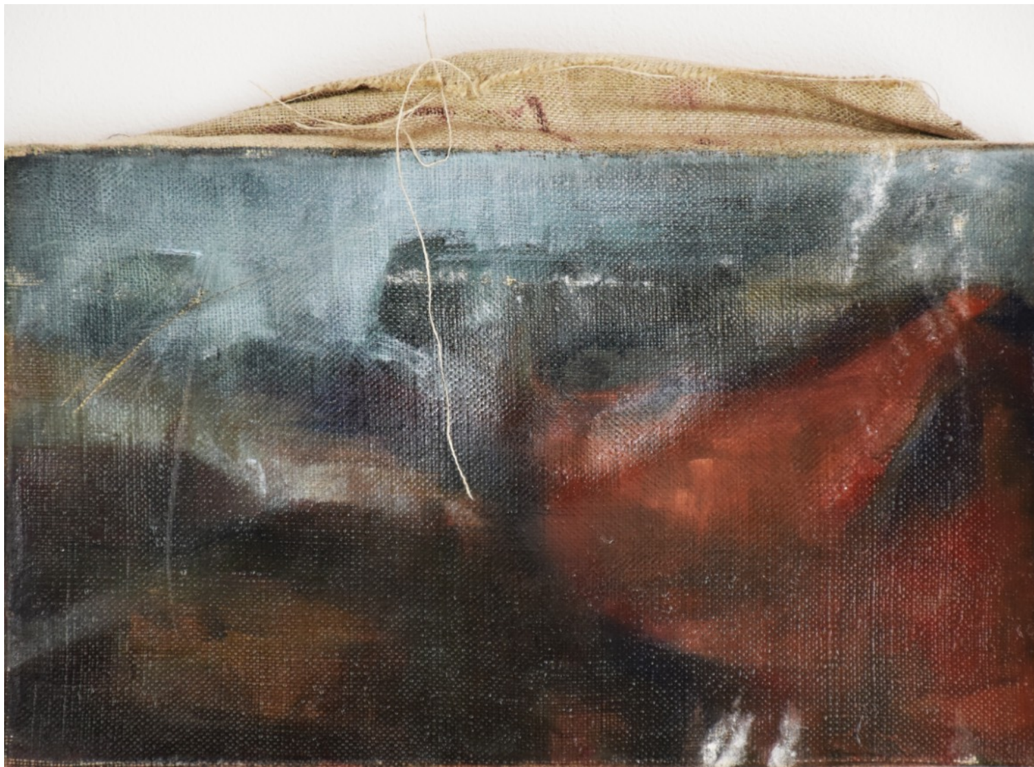
983 · inTIME MaURS 2018 · Huile sur lin · 16x27 cm