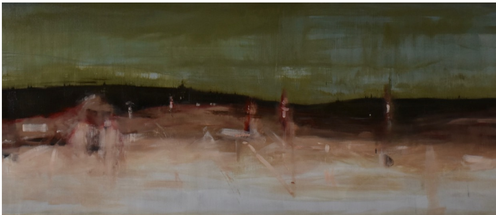
inTIME · ? Anthropocène | BRANCHE · Série picturale avec destruction conditionnelle · 2017 - 2018 ( première phase ) 2026 ( réouverture )