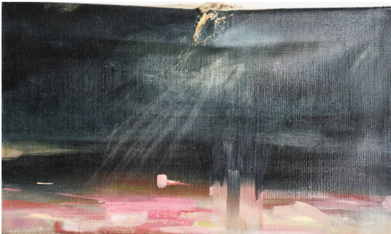
987 · inTIME MaURS 2018 · Huile sur lin · 24x41 cm