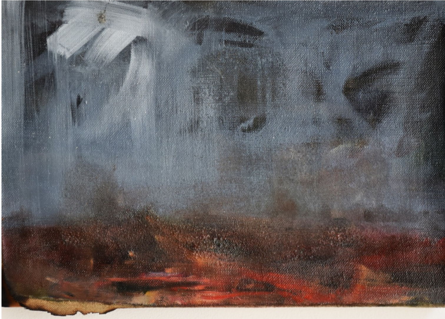
981 · inTIME MaURS 2018 · Huile sur lin · 24x35 cm