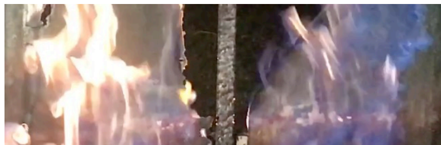
2019 – 12 es Journées Scientifiques du Réseau Français de Métabolomique et Fluxomique, Polydôme, Clermont Ferrand, France – "Anthropocène"