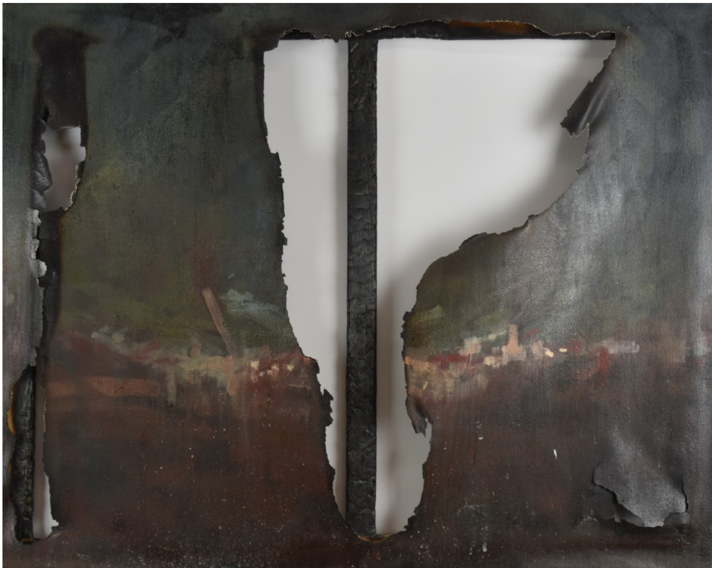
988 · inTIME MaURS 2018 · Huile sur lin · 73x92 cm