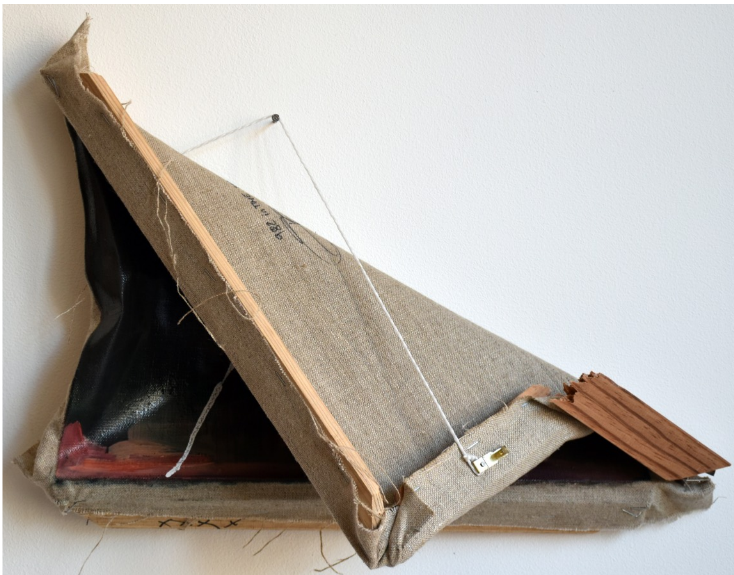
982 · inTIME MaURS 2018 · Huile sur lin · 30x40 cm