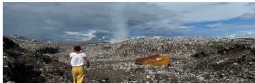
Décharge d'Antananarivo [2022] · premier séjour humanitaire FA.ZA.SO.MA. · [2016]. Déclencheur de la série.