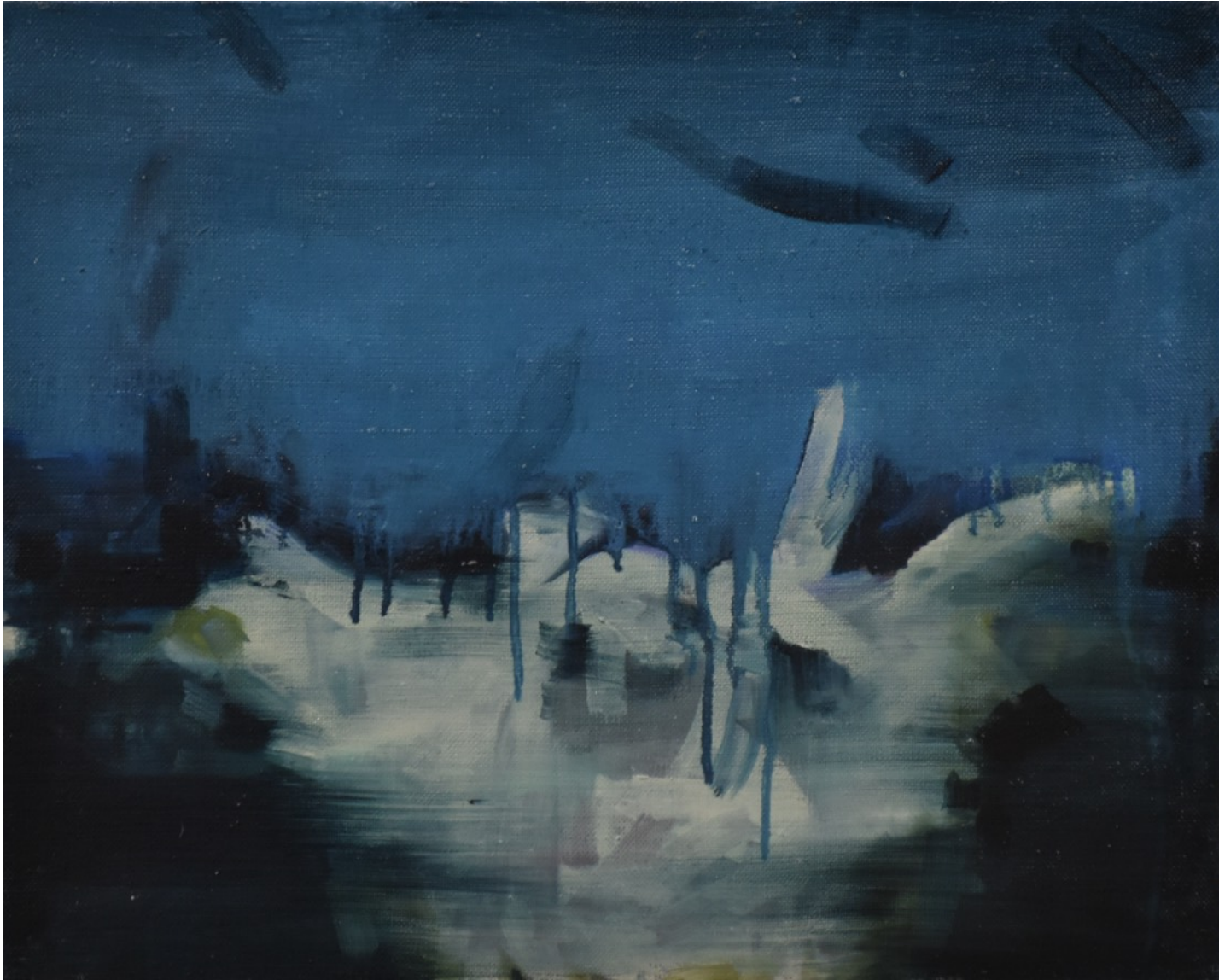
986 · inTIME MaURS 2018 · Huile sur lin · 33x41 cm