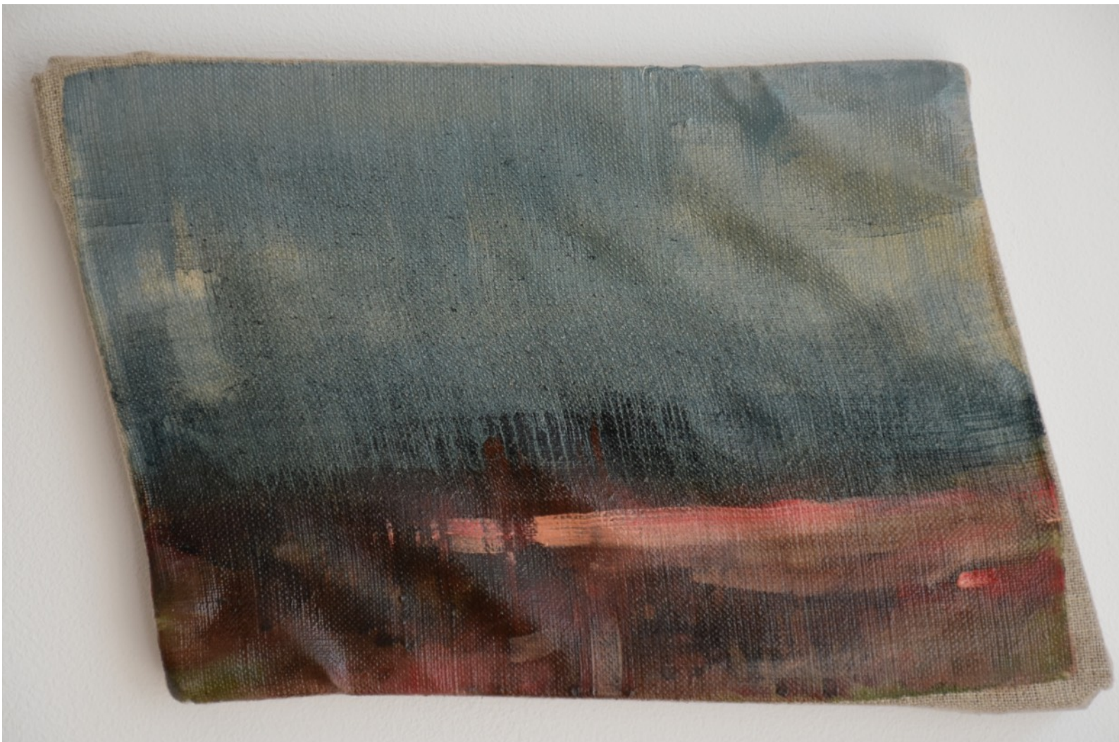
977 · inTIME MaURS 2018 · Huile sur lin · 19x27 cm