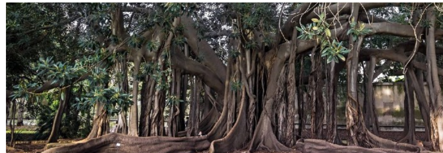
Ficus macrophylla monumental de Giardino Garibaldi, Piazza Marina à Palermo.

Une racine en 1987, un tronc en 2022 — le reste pousse encore. ou La peinture est la racine. Tout le reste est ce qu'elle devient.