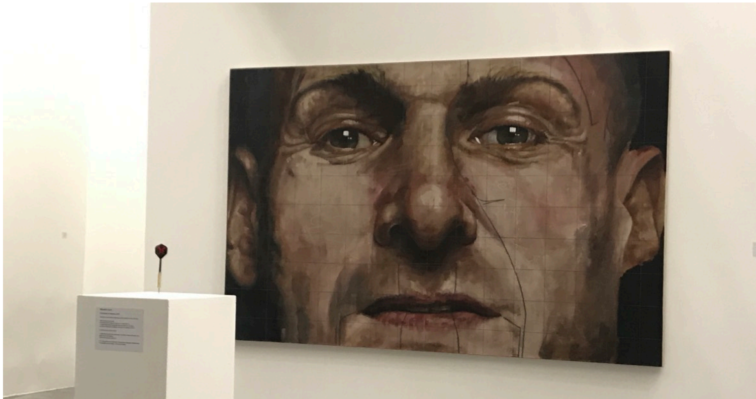
SEPPUKU · Installation participative · Espace Vallès · 2020

Les dispositifs performatifs et participatifs développés en parallèle du travail pictural interrogent la liberté, l'altérité et la responsabilité individuelle, en déplaçant ponctuellement l'acte artistique vers le corps et l'espace de relation. Ces expériences constituent un socle éthique et philosophique qui nourrit la peinture sans s'y substituer. La peinture demeure le lieu principal de l'expérience visuelle, de l'exposition et de la collection.