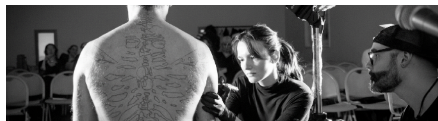
LbrE · Université Paris 1 Panthéon-Sorbonne · 2025 · Performance Participative