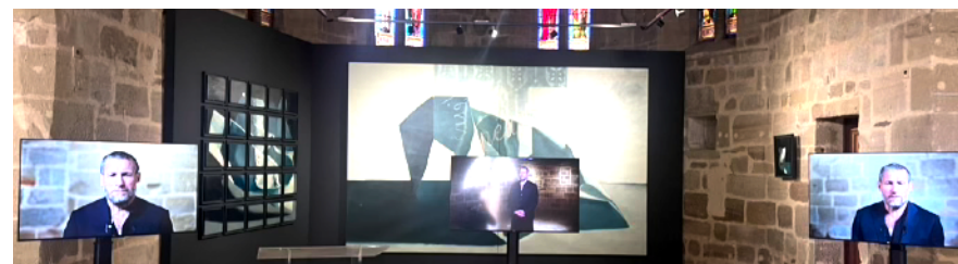
desÉQUILIBRES · Musée Labenche – Chapelle St-Libéral, Brive · 2024 · Solo Show

Sébastien Layral d'Alessandro sebastien@layral.fr www.layral.fr