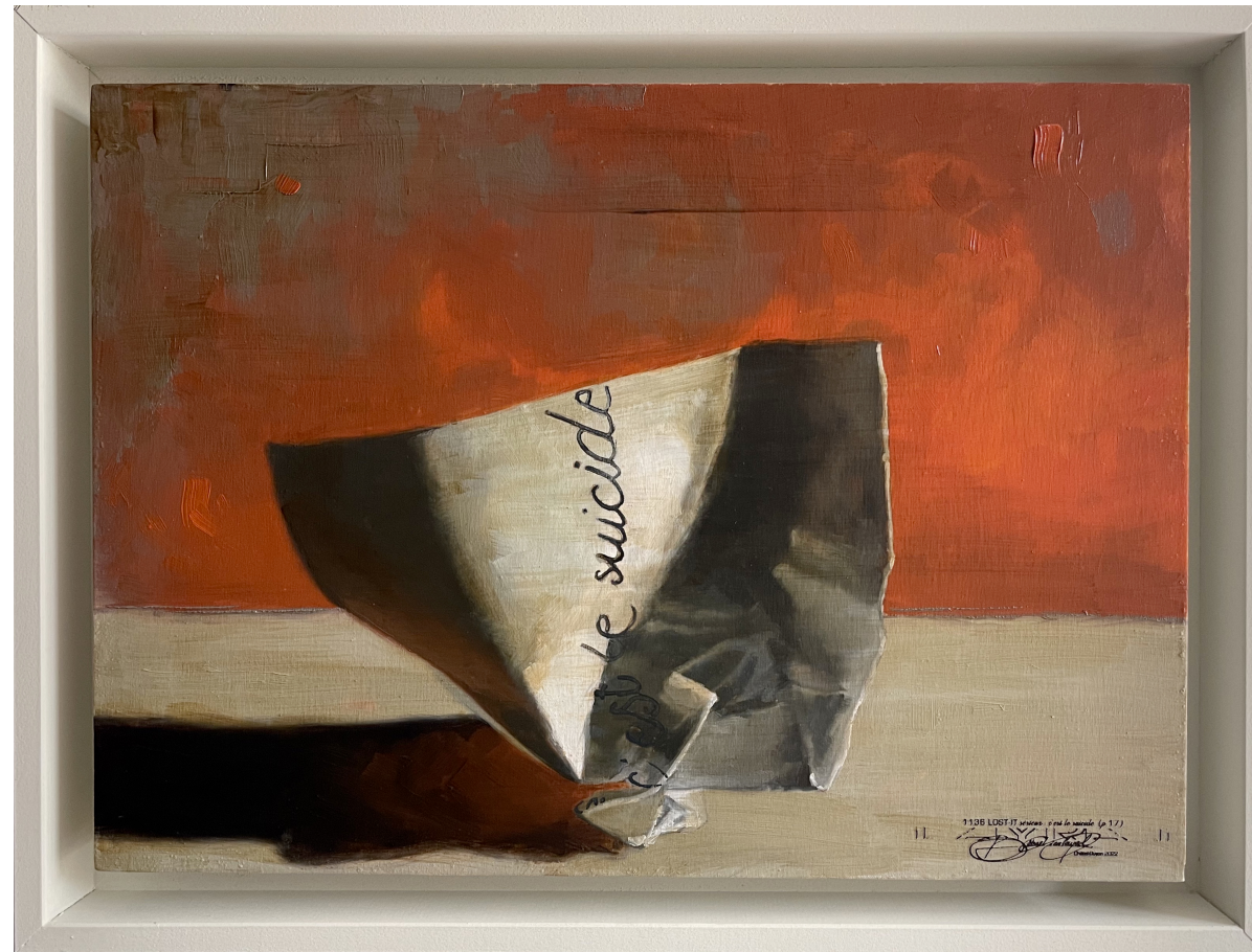
1136 LOst-It • « sérieux c'est le suicide. » • 2022 • Huile sur bois • 24x33cm [Œuvre 9/12 000]

LOst-It (2022–2122) est une série picturale au long cours composée de 12 000 peintures. Chaque œuvre transpose en peinture un Post-it froissé portant un fragment du Mythe de Sisyphe d'Albert Camus. Chaque peinture est autonome, datée et numérotée, intégrée à un corpus volontairement inachevable.