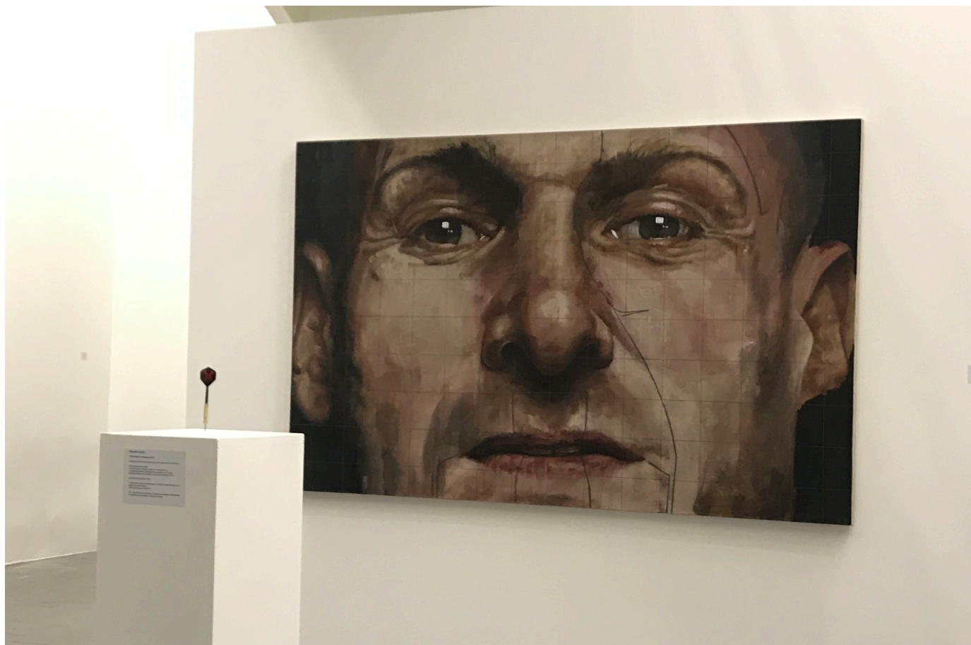
SEPPUKU • Installation participative • Espace Vallès • 2020

Les dispositifs performatifs et participatifs développés en parallèle du travail pictural interrogent la liberté, l'altérité et la responsabilité individuelle, en déplaçant ponctuellement l'acte artistique vers le corps et l'espace de relation.