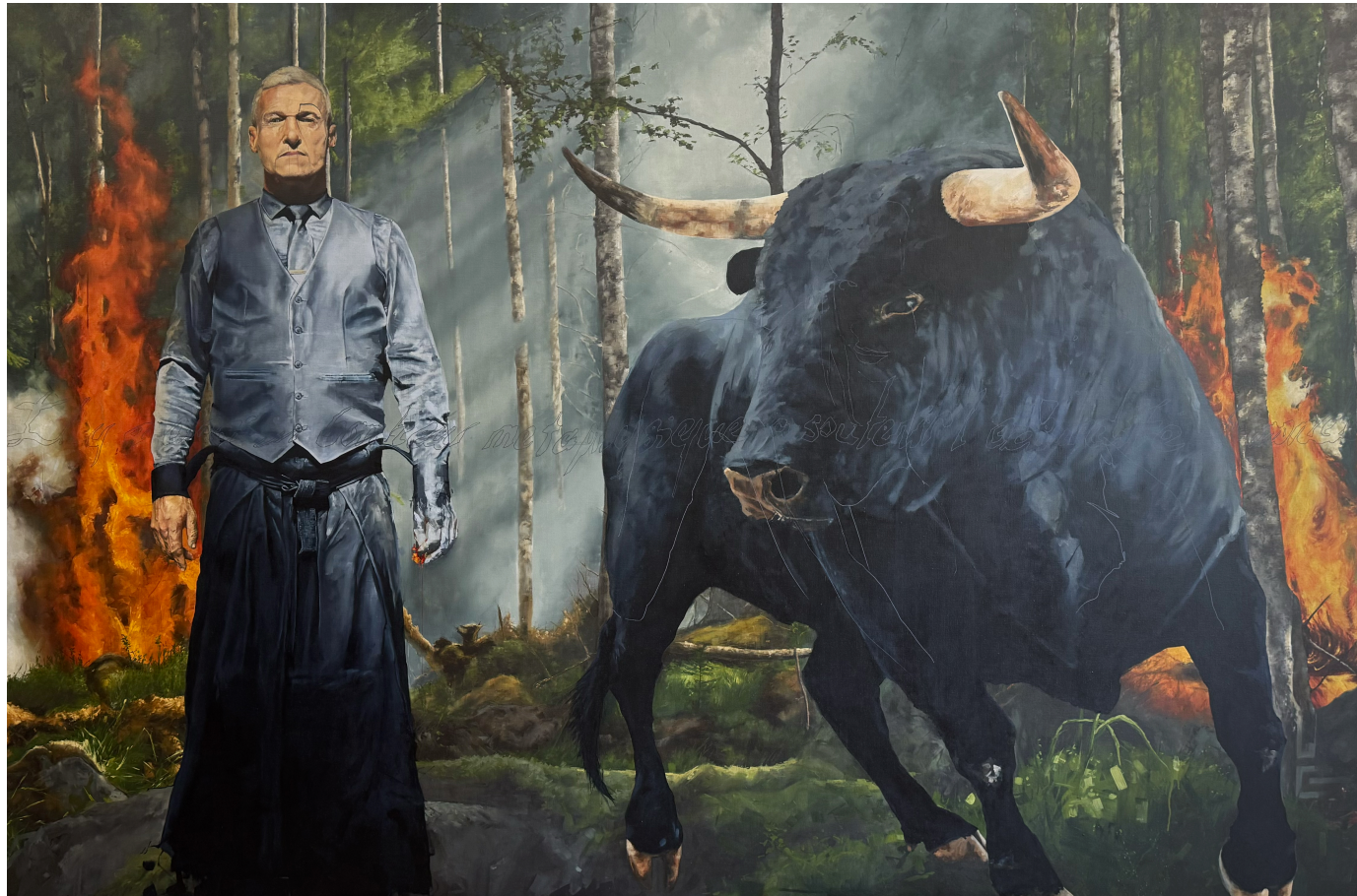
1265 PLaiSir • « Il y a ainsi un bonheur métaphysique ... » • 2025 • Huile sur toile • 180 x 272 cm [Œuvre 75/12 000]

PIAlsiR loSt-It (2025 - 2026) est une déclinaison picturale intégrée à la série LOst-It, dans laquelle le portrait devient le lieu d'appropriation individuelle de l'absurde.