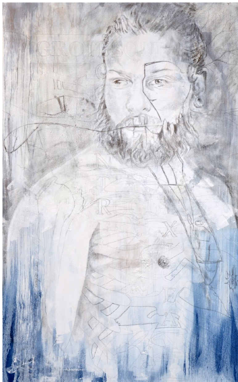
622 · VANITÉ Sébastien 2013 · Graphite & acrylique sur lin · 200x125 cm