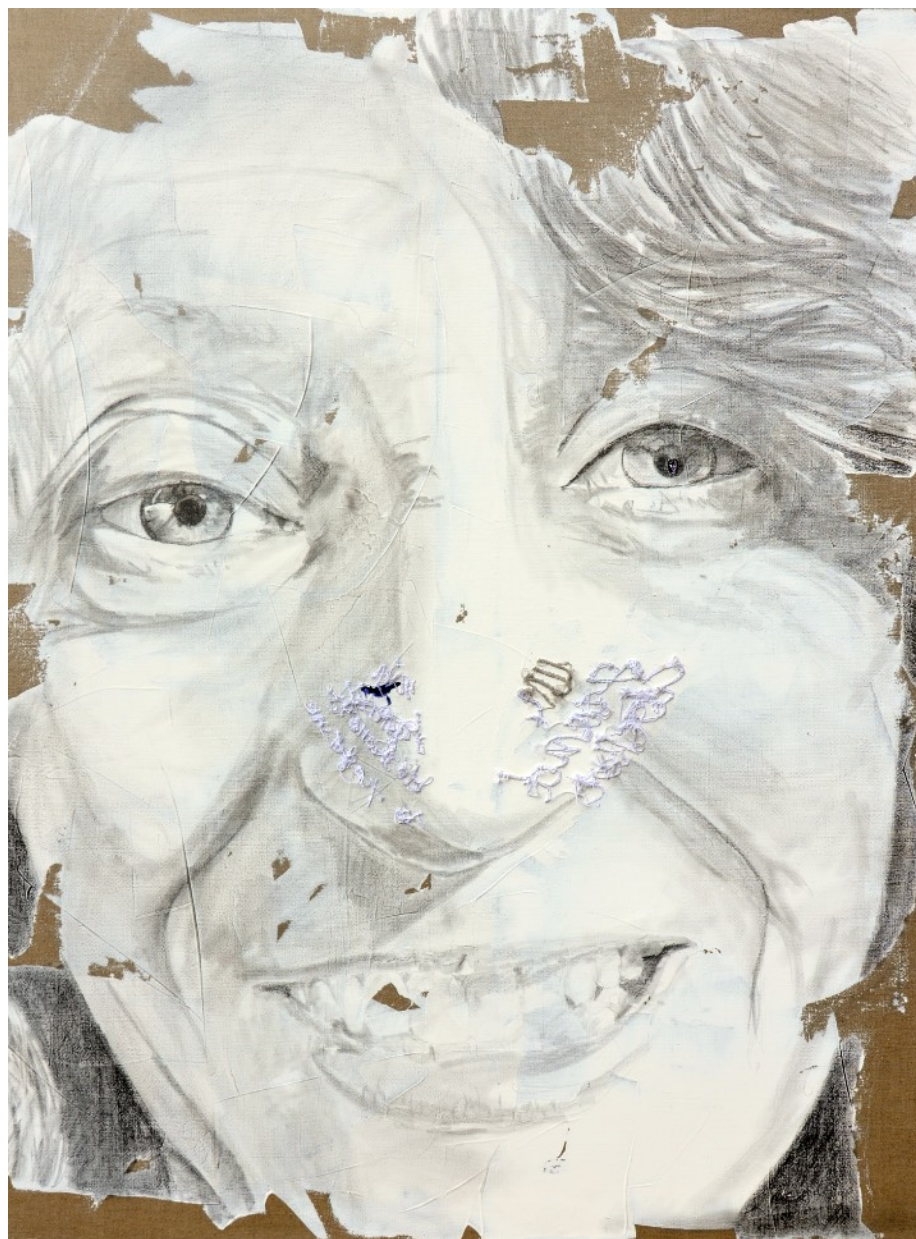
681 · VANITÉ Yolande 2013 · Graphite & acrylique sur lin · 130x97 cm