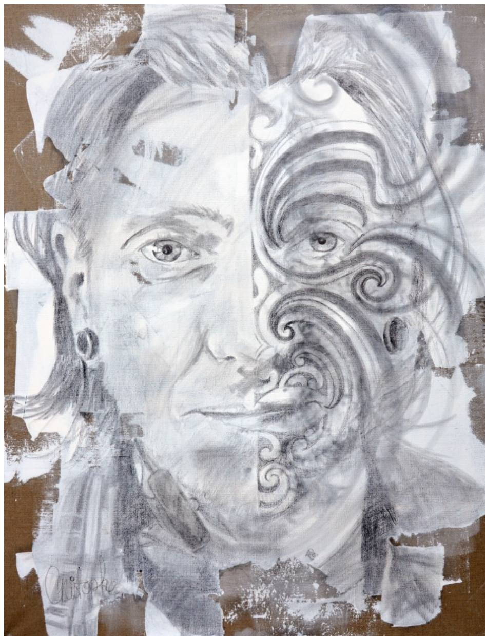
667 · VANITÉ Christophe 2013 · Graphite & acrylique sur lin · 130x97 cm