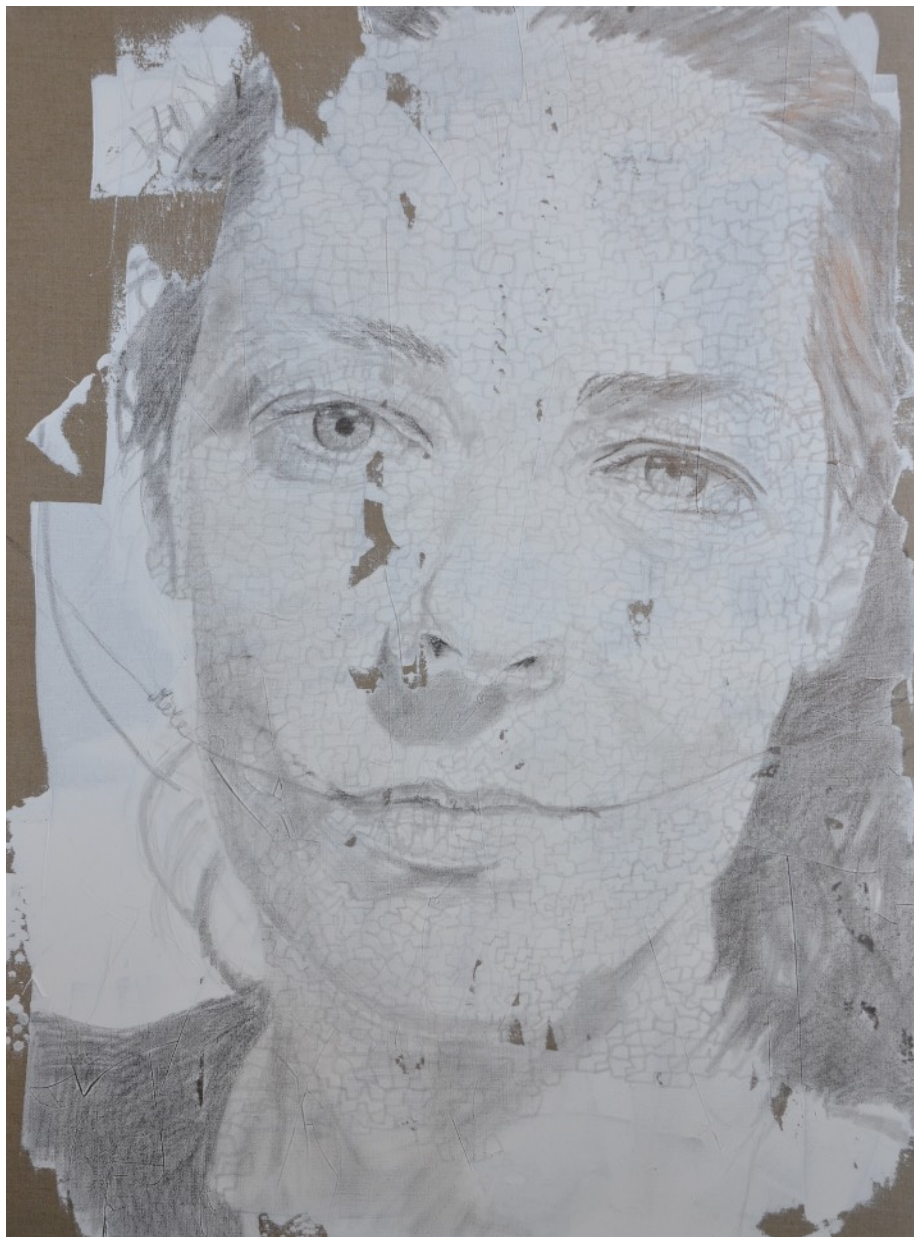
654 · VANITÉ Sophie 2013 · Graphite & acrylique sur lin · 130x97 cm