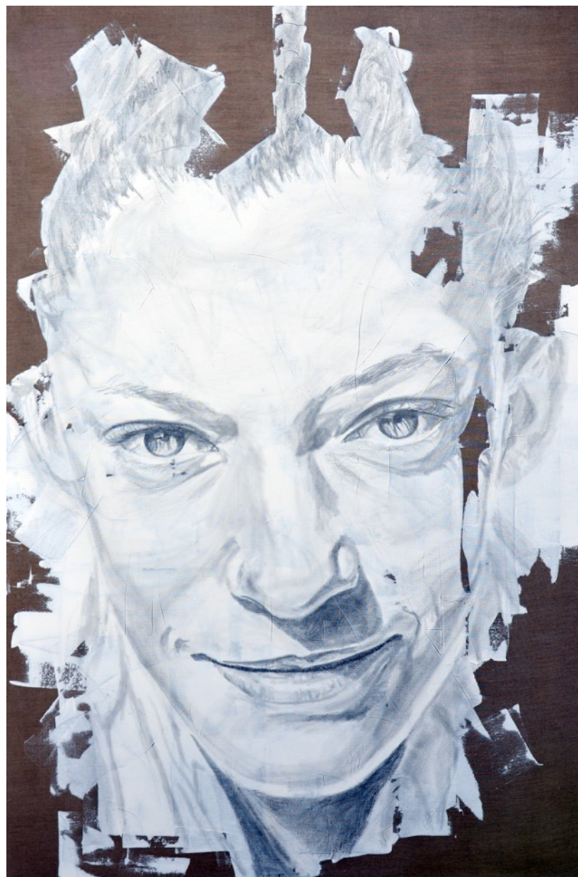
635 · VANITÉ Méline 2013 · Graphite & acrylique sur lin · 197x130 cm