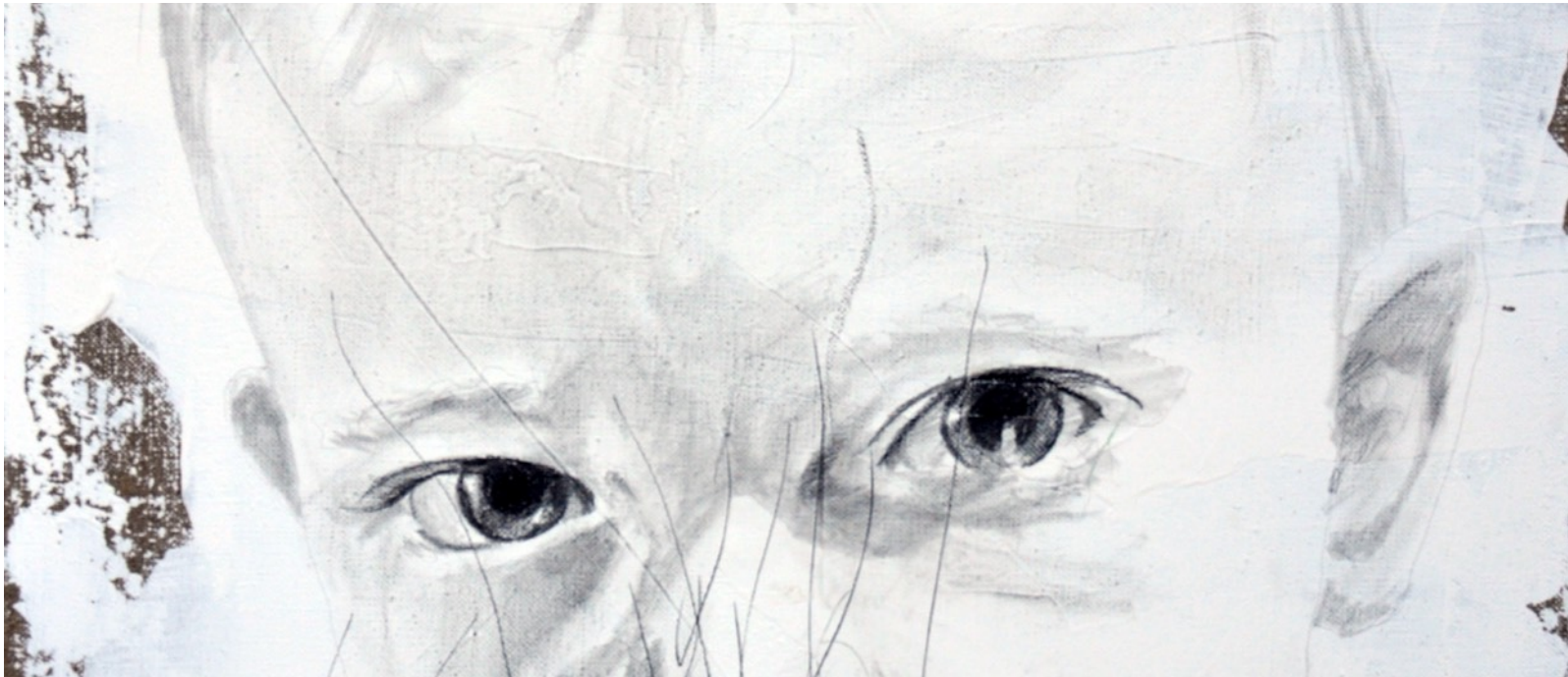
VANITÉ · ? enSEMBLE | RACINE · Série picturale participative · 2013–2017