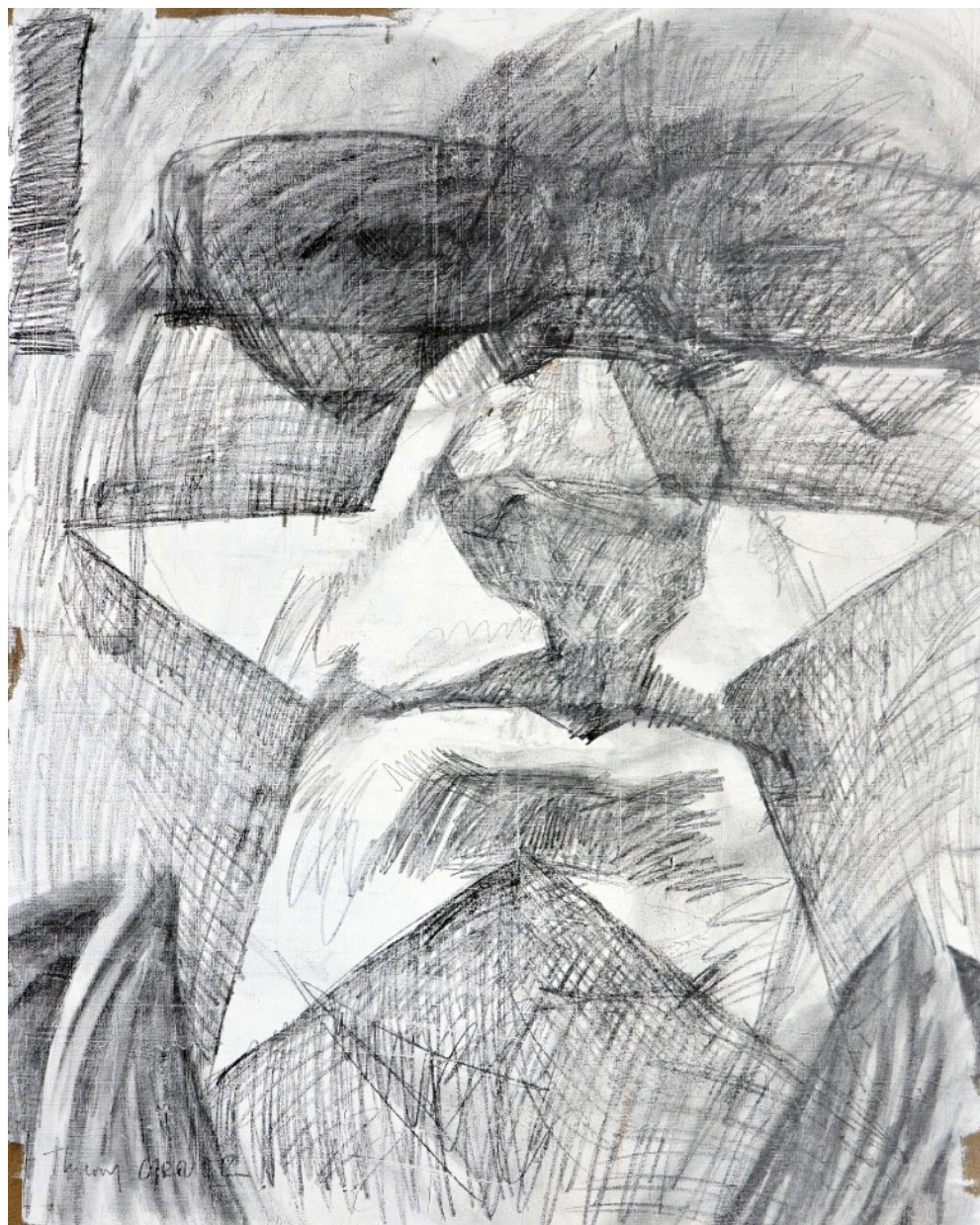
633 · VANITÉ Thierry 2013 · Graphite & acrylique sur lin · 130x97 cm