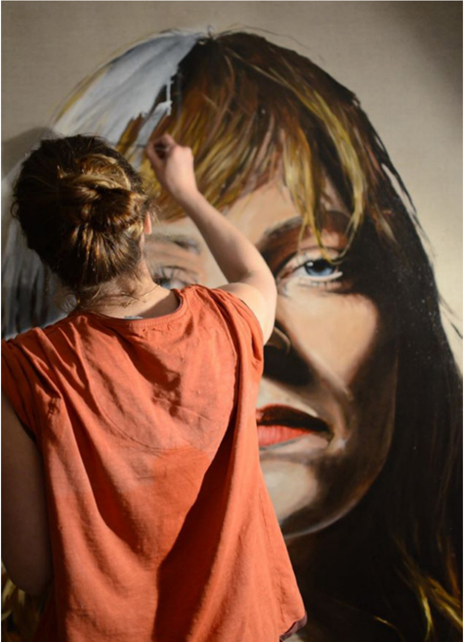
WIP DESIRE CORALIE (2014)