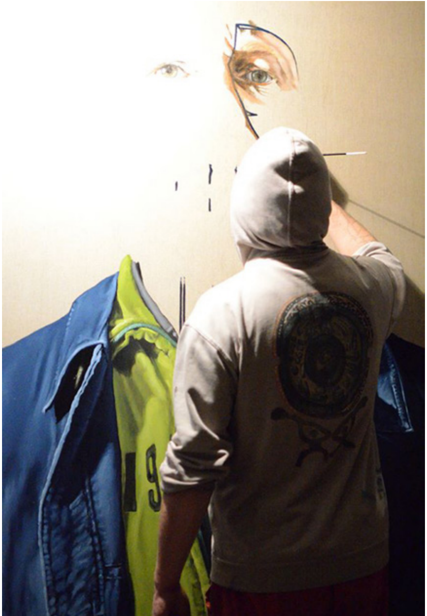
WIP DESIRE LAYRAL (2014)