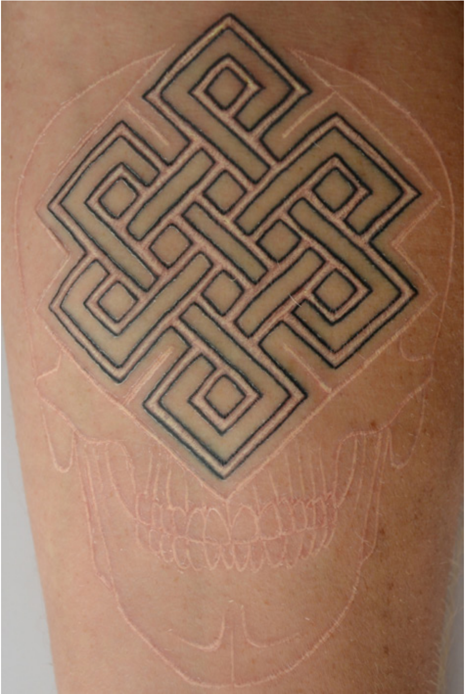
725 DESIRE CHRISTOPHE Tatouage-expression du piqueur (2014)