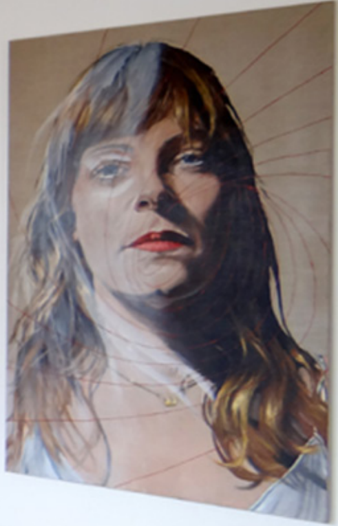
DESIRE Espace Vallès (2014)