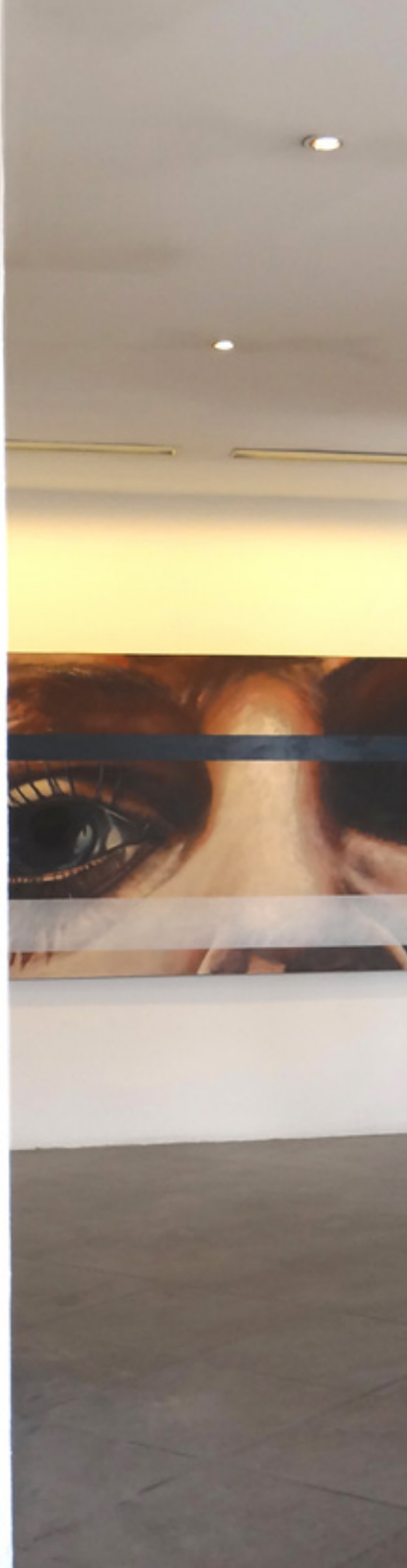
DESIRE Espace Vallès (2014)