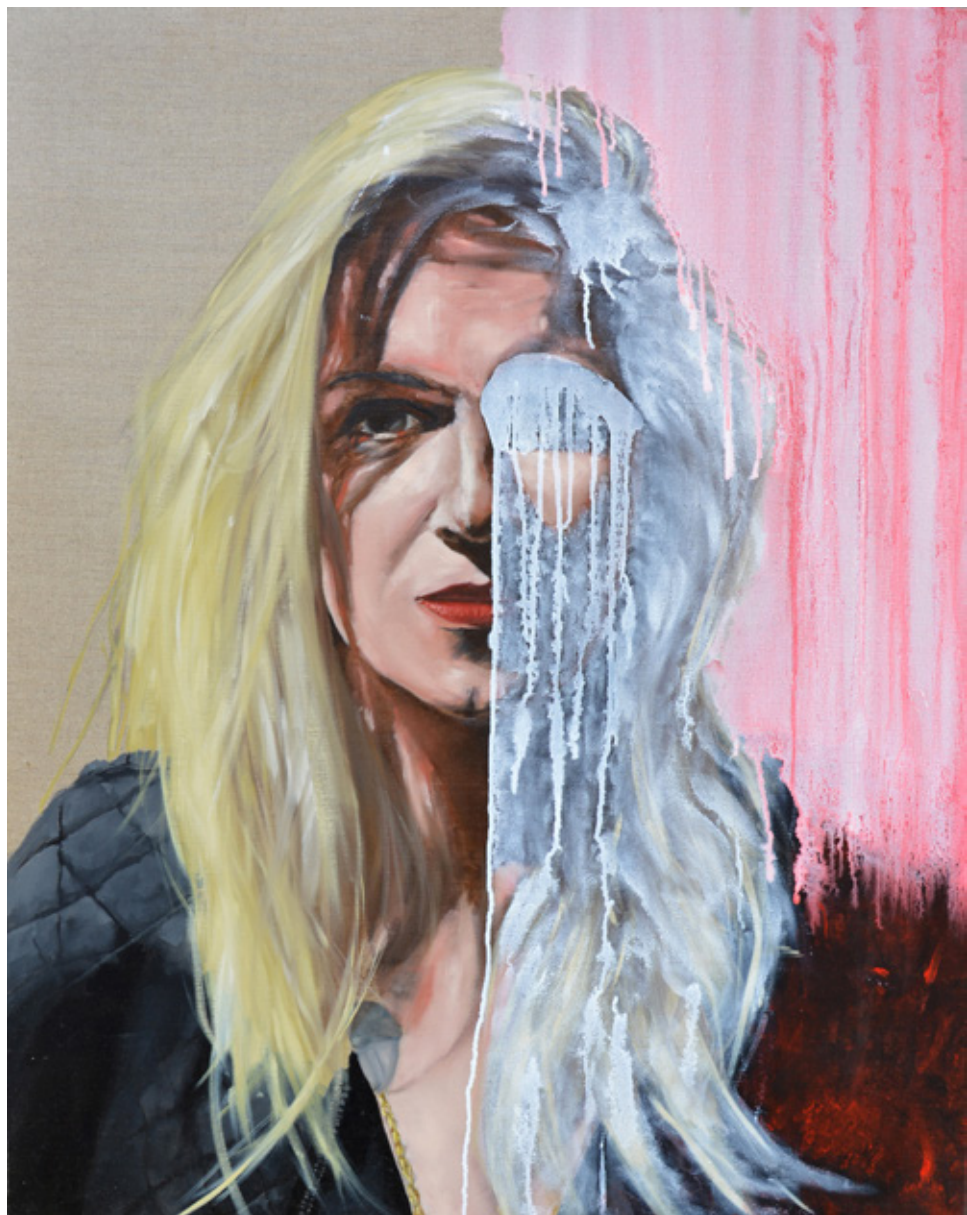
723 DESIRE ALEXANDRA Oil on linen (92x73) (2014)